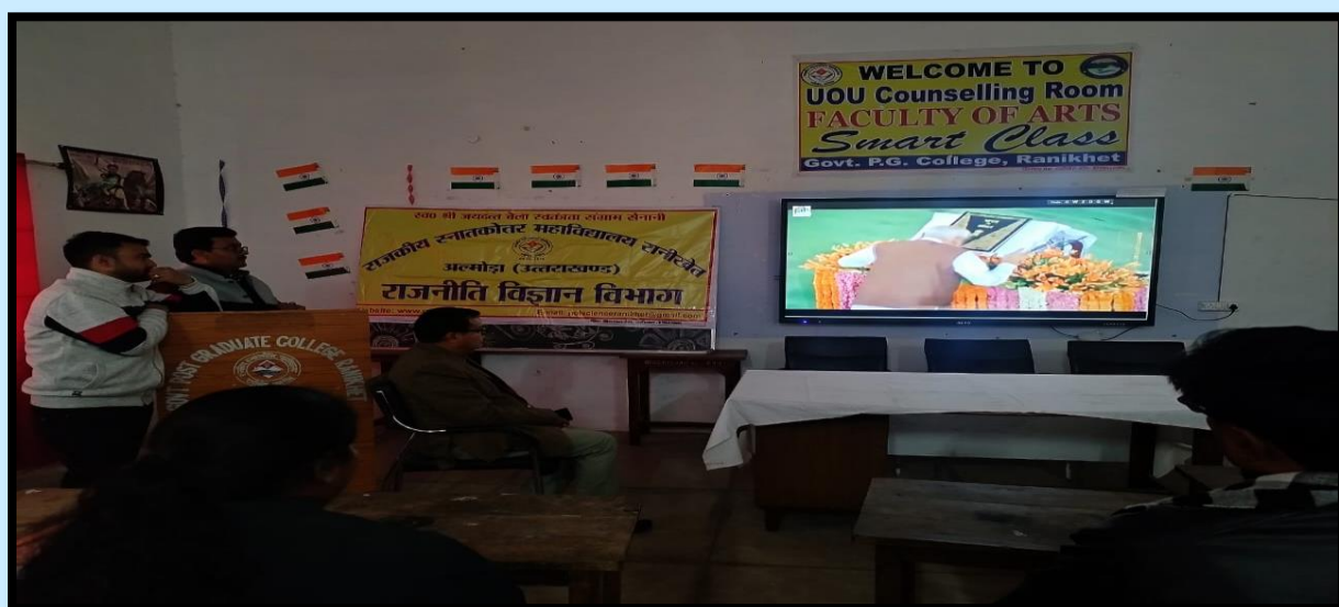
Glimpses of the Celebration of Constitution Day