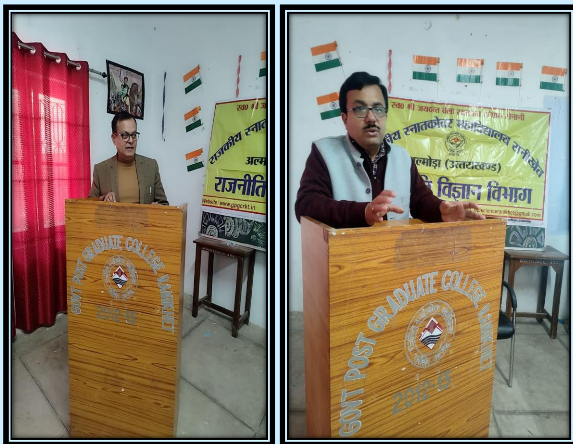
Glimpses of the Celebration of Constitution Day

The event marked an important step in promoting constitutional awareness and encouraged students to actively participate in preserving the ideals enshrined in the Constitution of India.