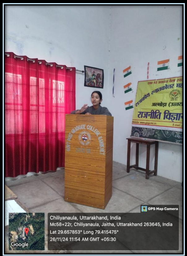
Glimpses of the Celebration of Constitution Day